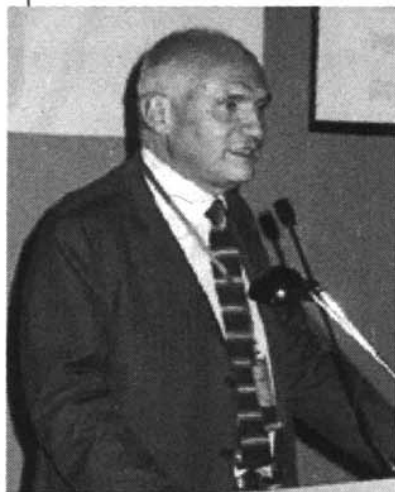
Ugo Intini , Vice Ministro degli Esteri

«Dai politici gli editori vogliono risposte chiare perché l'industria dei contenuti è un settore strategico»