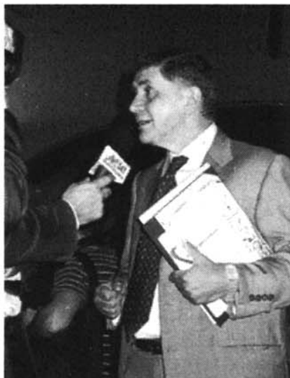
Rocco Buttiglione , Senatore, già Ministro per i Beni e le Attività Culturali

«Sino ad oggi non è stata predisposta una legge sul libro perché l'Italia è un Paese che non cresce economicamente»