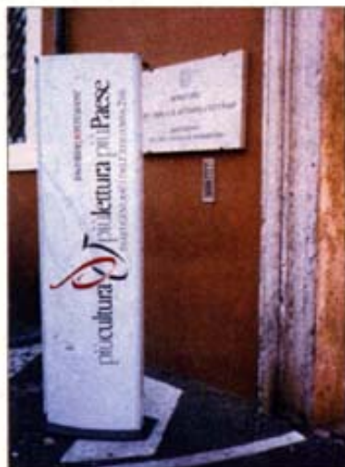
Il totem a evidenziare la porta di ingresso al Ministero.

« Il Ministero per i Beni e le Attività Culturali ospiterà il Centro per la Promozione della Lettura creato appositamente in attesa della legge nazionale sul libro »