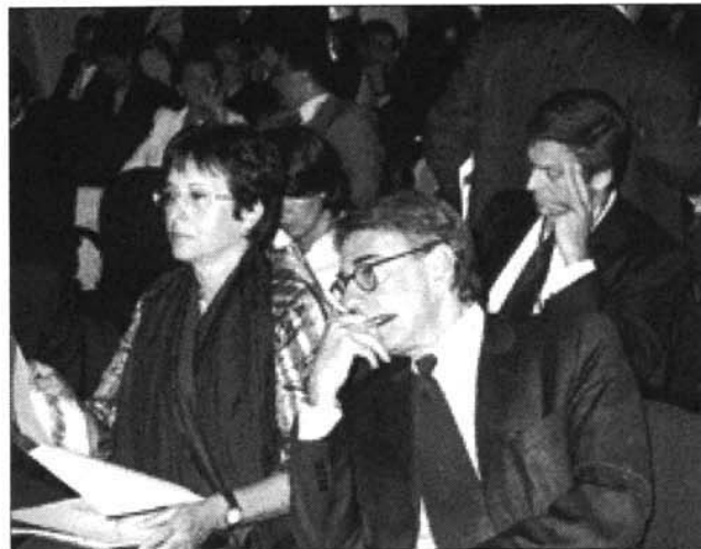
Vittoria Franco, Presidente Commissione Istruzione del Senato

«La cultura deve assumere nella società una posizione centrale»