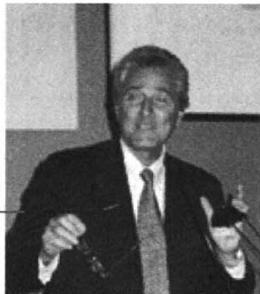
Francesco Rutelli , Vice Presidente del Consiglio e Ministro per i Beni e le Attività Culturali

«Sino ad oggi non è stata predisposta una legge sul libro perché l'Italia è un Paese che non cresce economicamente»